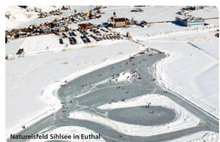
Natureisfeld Sihlsee in Euthal