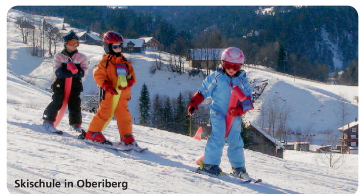
Skischule in Oberberg