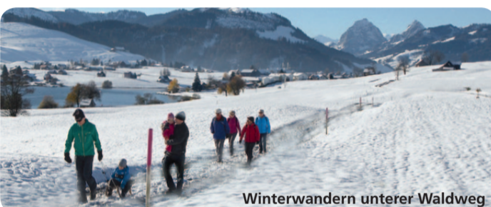
Winterwandern unterer Waldweg

Höchgütschstrasse, 8842 Unterberg Tel. 055 414 29 08 hochguetsch@bluewin.ch , www.hochguetsch.ch